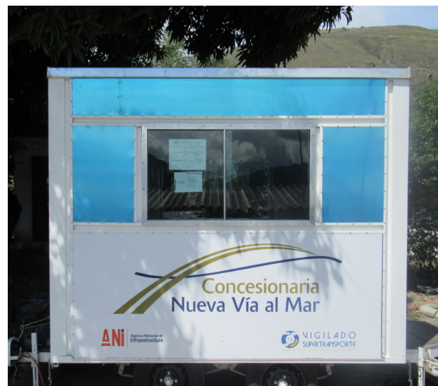
OFICINA MÓVIL Actualmente ubicada en Loboguerrero

Oficina Principal de Atención al Usuario La Cumbre Corregimiento de Pávas Contacto: 317 646 23 54 - Dirección: Calle 4 No. 5 - 28 atencionalusuario@covimar.com.co www.covimar.com.co